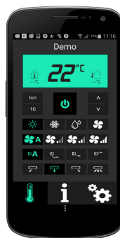
Appstyrning via Wi-Fi finns som tillbehör.

*För att garantin ska gälla behöver du serva värmepumpen efter tre år. Regelbunden service gör också att du sänker dina värmekostnader samtidigt som du minskar risken för driftstopp.